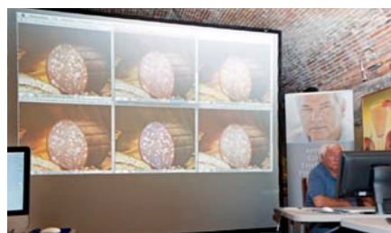
Un momento della valutazione delle immagini