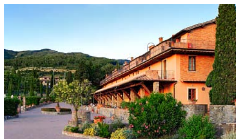
Il ristorante e la zona congressuale con le aule