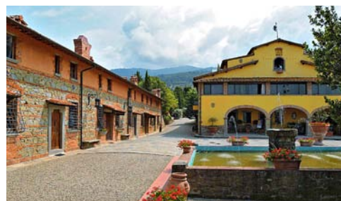
La piazzetta principale della Fattoria

Le lezioni si tengono vicino all'ex tinaia dove ci sono le aule e le attrezzature necessarie per il corso. I coffee break vengono serviti nel giardino con vista panoramica oppure nella veranda. Il collegamento Internet non è disponibile nelle aule ma è possibile connettersi gratuitamente tramite wireless in altre aree preposte all'interno della struttura.