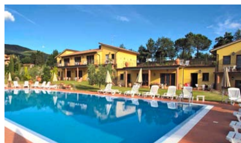
La Country House con le camere degli allievi