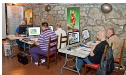
Un momento delle esercitazioni pratiche