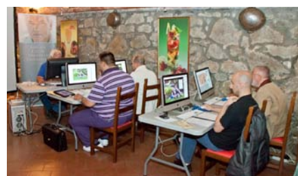
Un momento delle esercitazioni pratiche